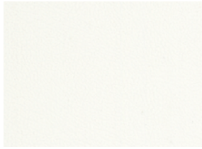
Marble white F4357-10120 Mármol blanco