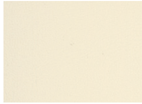
Sand F4357-5029 Arena