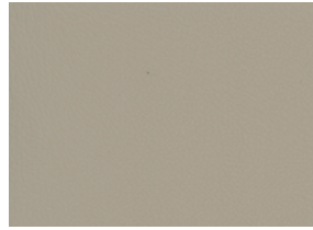
Linen F4357-20354 Lino